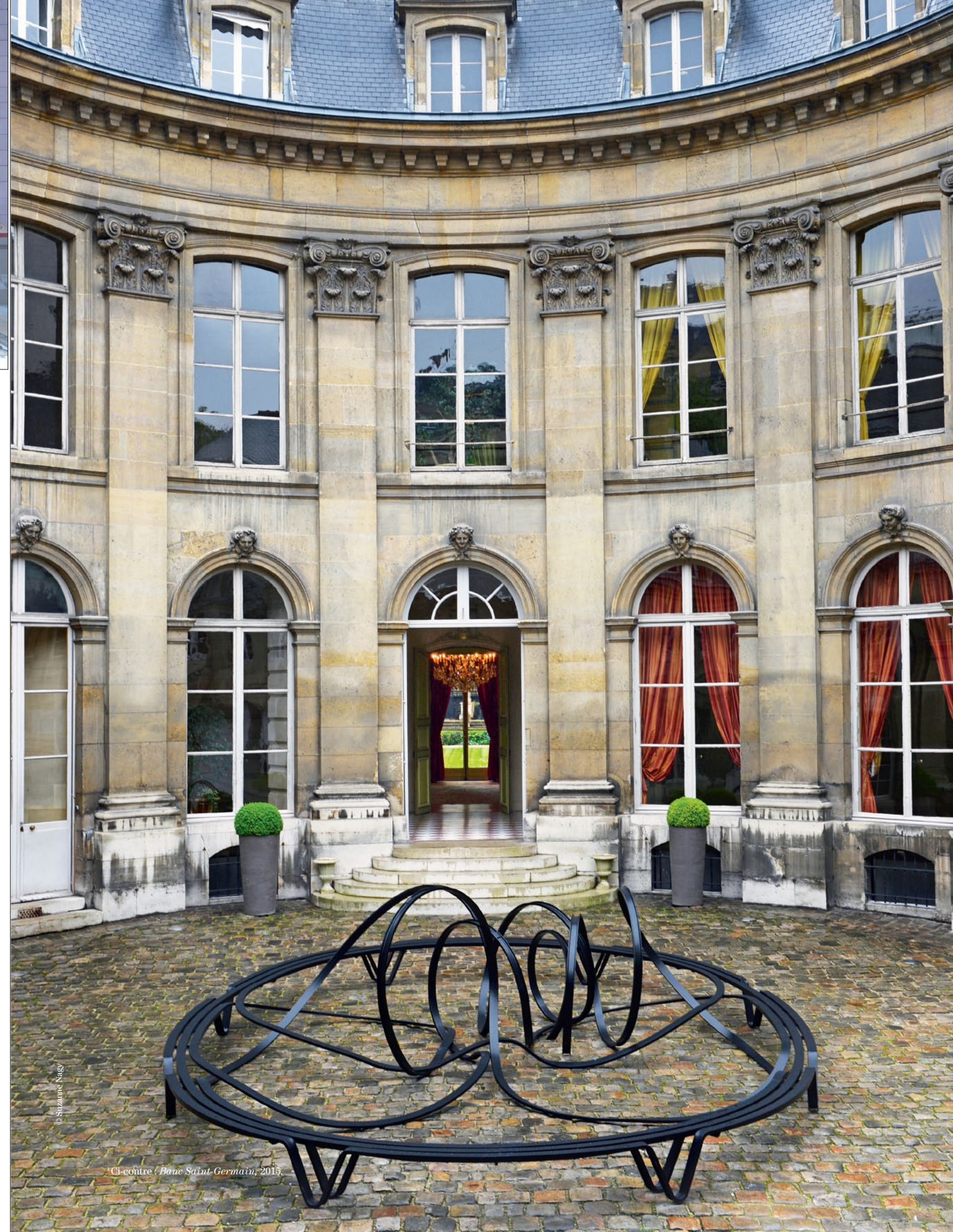
Ci-contre / Banc Saint-Germain, 2015.