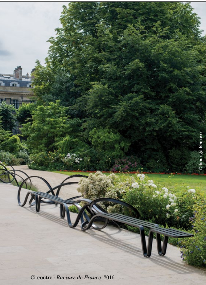
Ci-contre : Racines de France. 2016.