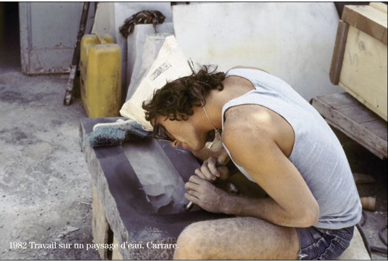
1982 Travail sur un paysage d'eau, Carrare.

Une première importante monographie dédiée à l'œuvre de Pablo Reinoso vient d'être publiée par 5 Continents Editions. L'occasion d'aborder le travail majestueux de cet artiste et designer franco-argentin.