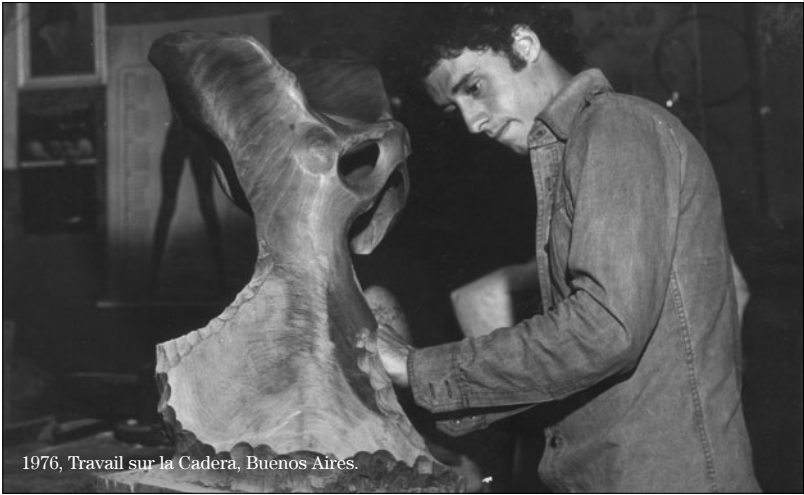
1976, Travail sur la Cadera, Buenos Aires.