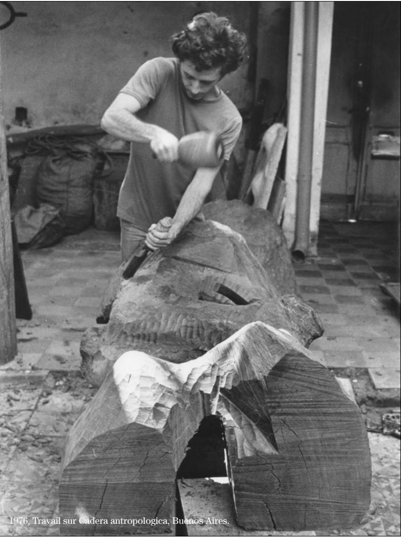
1976, Travail sur Cadera antropologica, Buenos Aires.