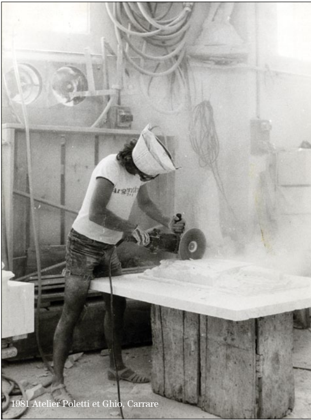
1981 Atelier Poletti et Ghio, Carrare