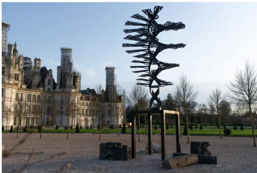
"Révolution végétale (d'après Léonard)" de Pablo Reinoso. (Domaine national de Chambord)